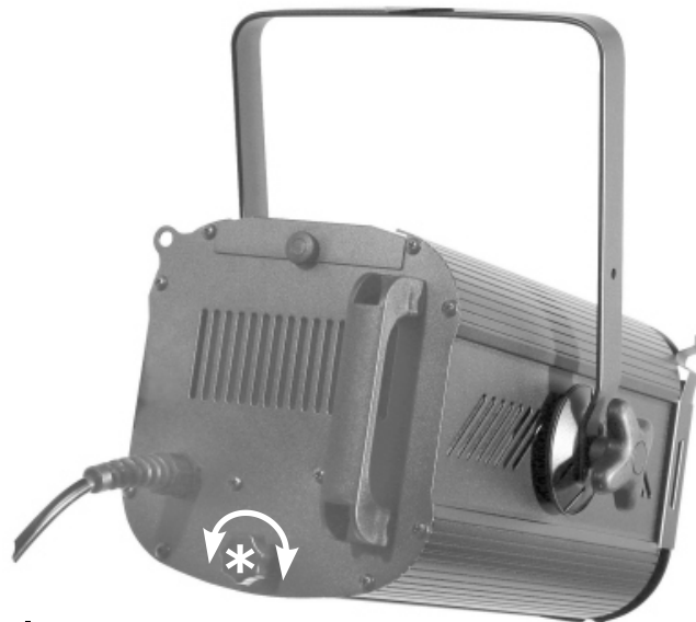
* Pomello di regolazione dell' angolo di apertura Knob for beam angle adjustment

Le informazioni contenute in questo documento sono state attentamente redatte e controllate. Tuttavia non è assunta alcuna responsabilità per eventuali inesattezze. Tutti i diritti sono riservati e questo documento non può essere copiato, fotocopiato, riprodotto per intero o in parte senza previo consenso scritto della D.T.S. .D.T.S. si riserva il diritto di apportare senza preavviso cambiamenti e modifiche estetiche , funzionali o di design a ciascun proprio prodotto. D.T.S. non assume alcuna responsabilità sull'uso o sull'applicazione dei prodotti o dei circuiti descritti.